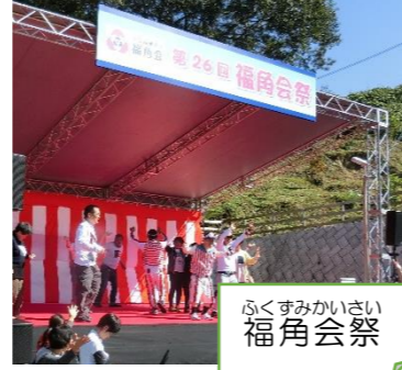
ふくすみかい 福角会祭