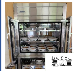
おんそうこ 温蔵庫