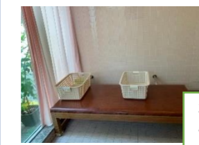
だついじょ 脱衣所