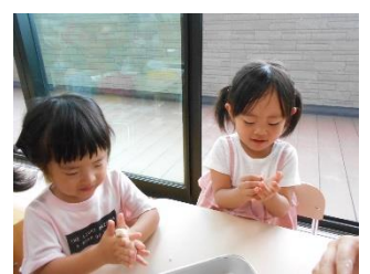
ほし組さんも 指でつつん やわらかいね～