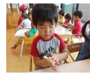
まーるく まーるく おだんごの形に… できるかな??