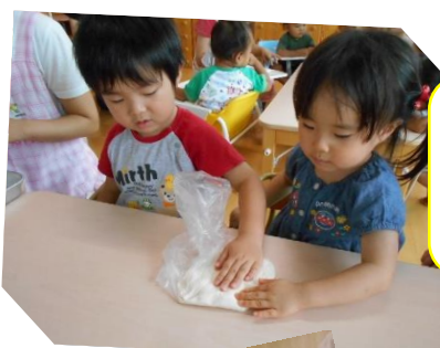
ちからを合わせて よいしょ よいしょ…